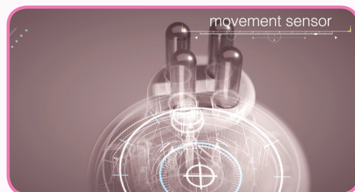
PIÈCE À MAIN EXTERNE